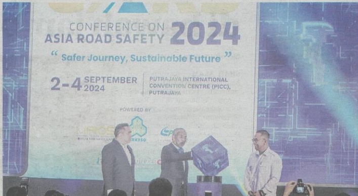
AHMAD ZAHID (tengah) ketika melancarkan Majlis Perasmian Persidangan Keselamatan Jalan Raya Asia 2024 di Putrajaya semalam.

Sementara itu, dalam ucapannya, Ahmad Zahid berkata,