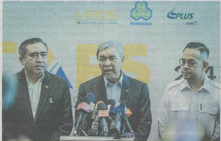
AHMAD Zahid Hamidi dalam sidang akhbar selepas melawat tapak pameran Persidangan Keselamatan Jalan Raya Asia (CARs) 2024 di Putrajaya, semalam.

Sementara itu, Ahmad Zahid ketika berucap berkata, berkuat kuasa 1 Januari tahun hadapan, semua motosikal baharu dengan enjin berkapasiti 150cc ke atas wajib dilengkapi dengan